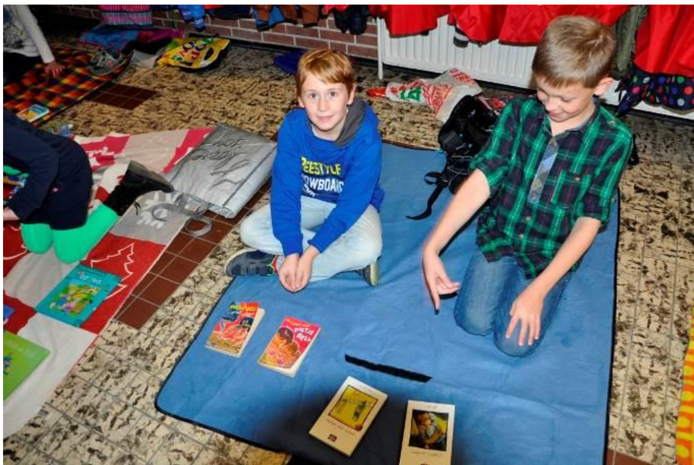
Kleedjesmarkt tijdens de kinderboekenweek

De school conformeert zich aan het 'Protocol Sociale Media SKOT, mail- en internetgebruik'. De SKOT vertrouwt erop dat haar medewerkers, leerlingen, ouders/verzorgers en andere betrokkenen verantwoord om zullen gaan met sociale media en heeft dit protocol opgezet om een ieder die bij een school van de SKOT betrokken is of zich daarbij betrokken voelt daarvoor richtlijnen te geven. Het genoemde protocol vindt u onder andere op de website van onze school.